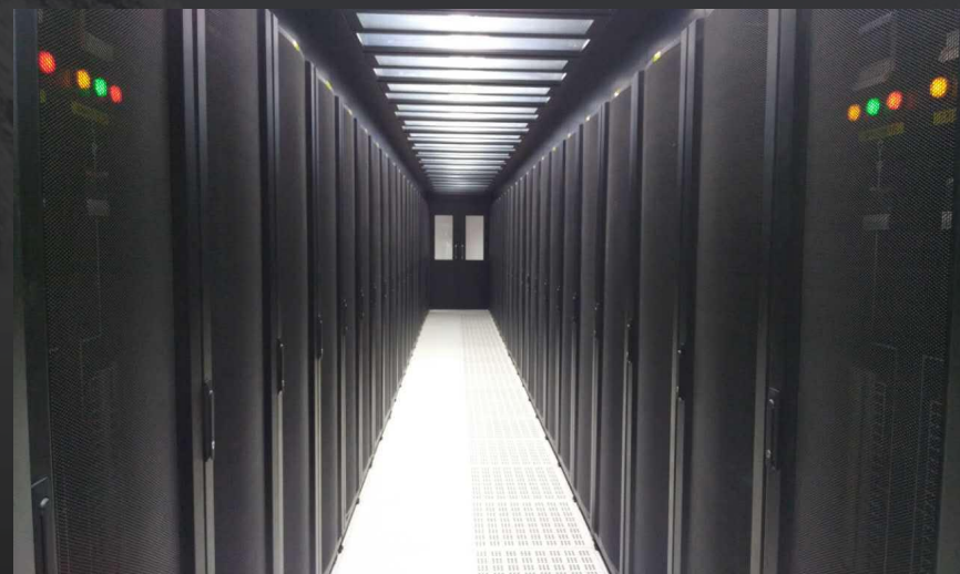
联想云数据中心 (北京, 武汉, 香港, 罗利)