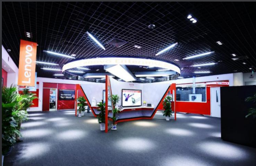
企业级展示中心 (北京,斯图加特, 罗利)