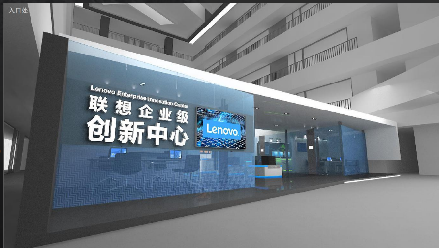
企业级创新中心 (北京,斯图加特, 罗利)