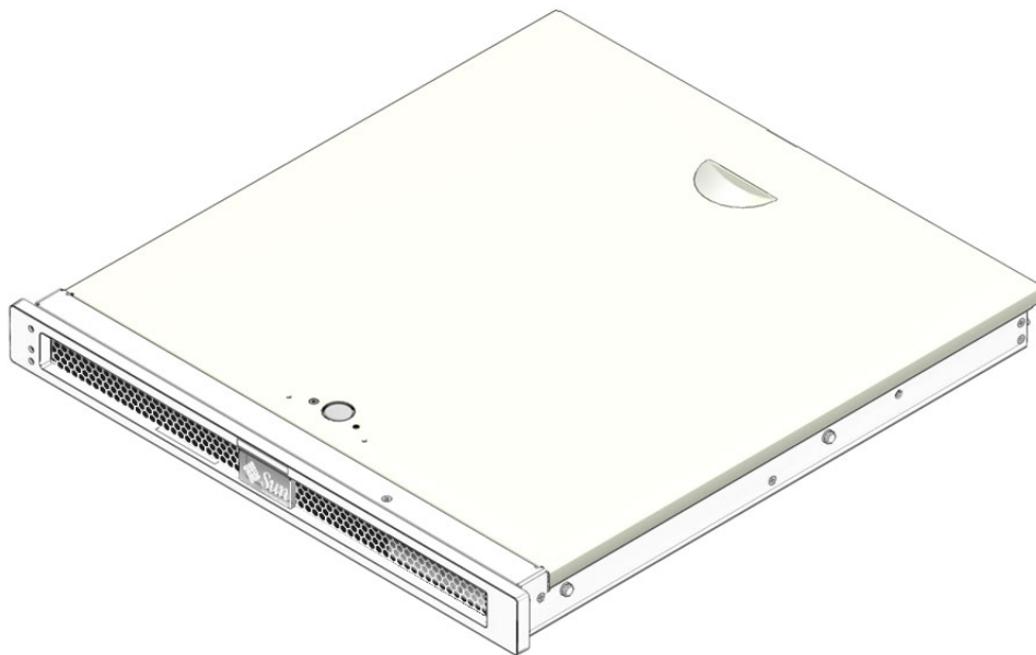
图 1 Sun Fire T1000 服务器

Sun Fire T1000 服务器是一种具强大伸缩性和高度可靠性的高性能入门级服务器。Sun Fire T1000 服务器为用户提供了多种选择，以满足不同的业务需求。